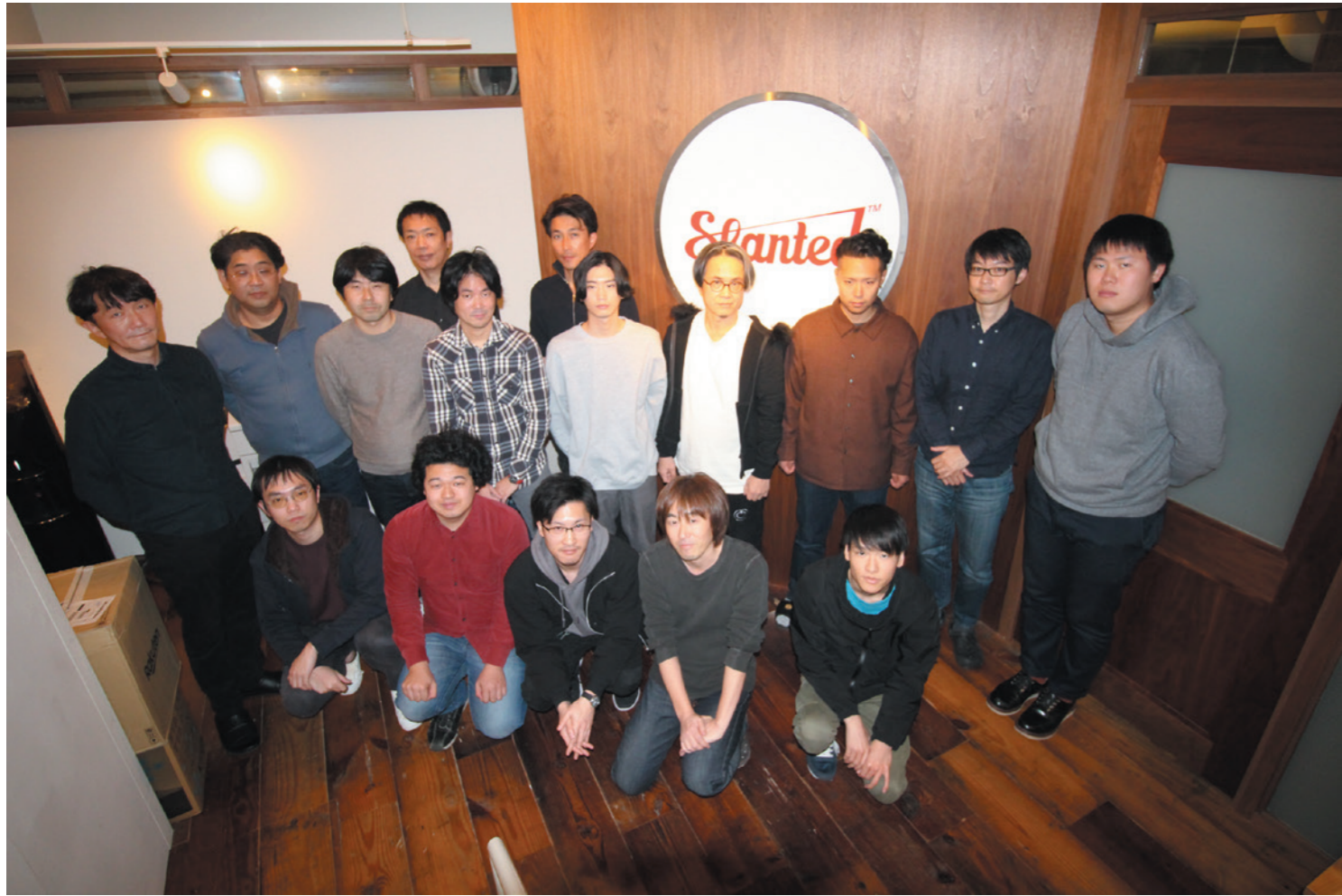
slantedのスタッフの皆さん